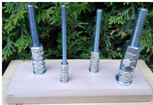
šrouby a matice