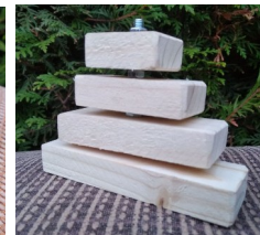
stromek – pyramida