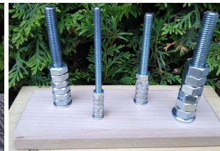
šrouby a matice