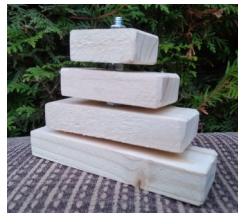
stromek – pyramida