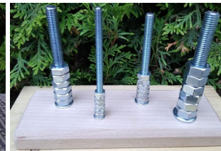
šrouby a matice